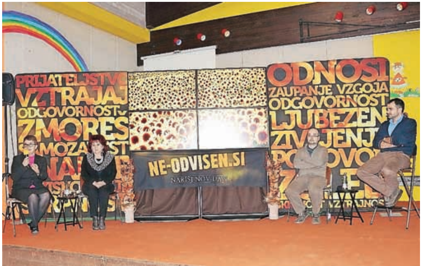
Družabni večer za odrasle na Osnovni šoli Toneta Čufarja Jesenice