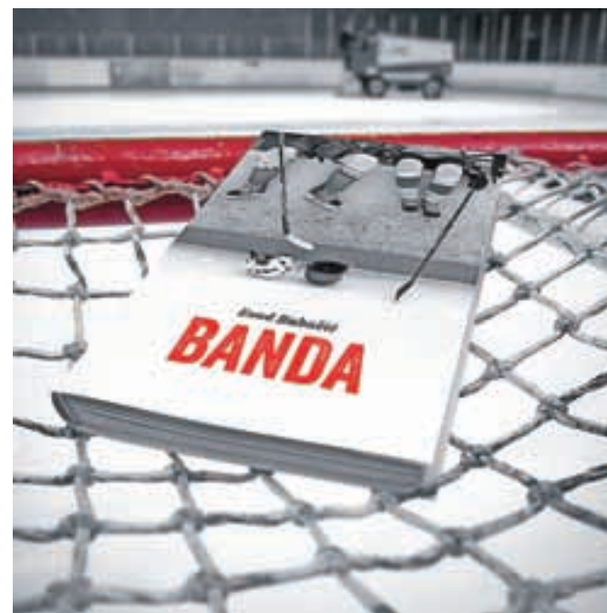
Knjigo Banda bodo predstavili drevi v Kolpernu.