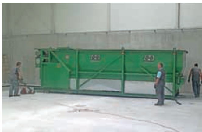
Del opreme je v sortirnici že nameščeno.