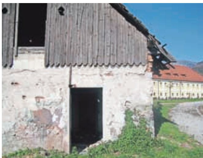
Korenova hiša je ostala v spominu nekaterih Jeseničanov in na arhivskih fotografijah.