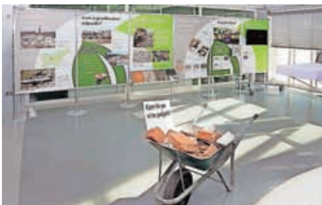
Razstava v avli občine bo na ogled do 20. decembra.

V avli Občine Jesenice je na ogled mobilna razstava na temo gradbenih odpadkov. Ta prikazuje, kako pristopiti k rušenju objektov, kam z nastalimi gradbenimi odpadki in kako iz gradbenih odpadkov pridobimo kakovostno surovino za nadaljnjo uporabo v gradbeništvu. V enem od panojev je tudi monitor, kjer se vrtita dva filma – eden na temo črne jeklerske žlindre, drugi na temo gradbenih odpadkov. Razstava je postavljena v sklopu projekta ReBirth – Promocija recikliranja industrijskih in gradbenih odpadkov in njihove uporabe v gradbeništvu, ki ga finančno podpirata Evropska unija, program LIFE+, in Ministrstvo za kmetijstvo in okolje Republike Slovenije.