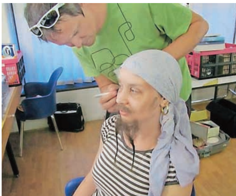
Kako iz dekleta nastane gusar ... / FOTO: ARHIV GLEDALIŠČA