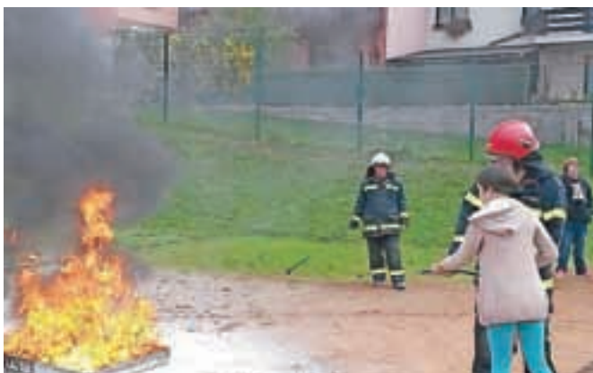
Nekateri učenci so se tudi sami preizkusili v gašenju.