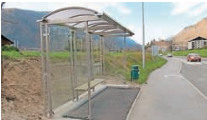
Osem novih nadstreškov na avtobusnih postajališčih

Med aktualnimi informacijami pa je župan tudi povedal, da se pripravljajo na gradnjo kanalizacije in vodovoda na območju Senožeti, postavljenih pa je tudi že osem novih nadstreškov na avtobusnih postajališčih, za kar so pridobili evropski denar.