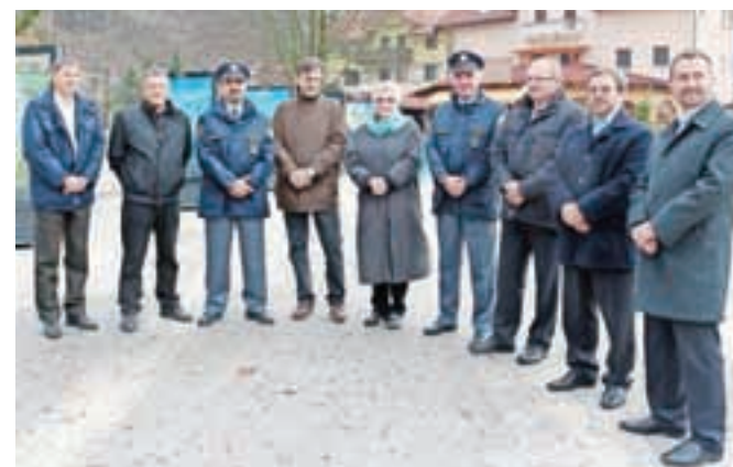
Z odprtja razstave fotografij izstopajočih objektov, ki zaznamujejo slovenski avtocestni križ.

Razstava ob 40-letnici avtocest bo na Jesenicah na ogled do 9. decembra, nato se seli še v Novo mesto in Mursko Soboto.