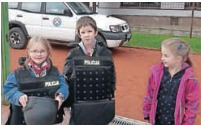
Učenci so si lahko nadelo neprebojni jopič.